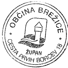
Ivan Mplan Župan občine Brežice

Številka: 450-0004/2018 Brežice, marec 2018