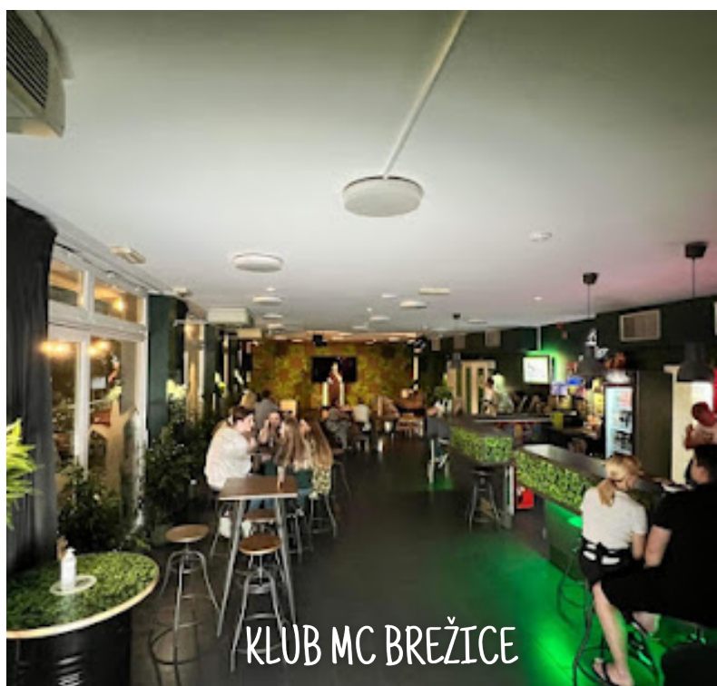
KLUB MC BREŽICE