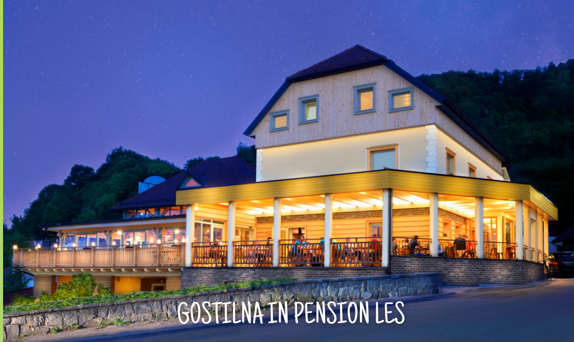
GOSTILNA IN PENSION LES