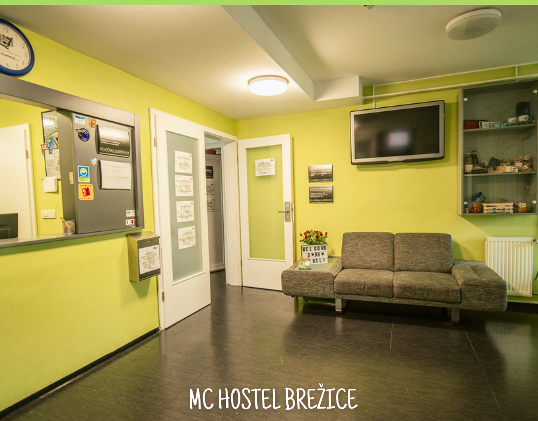
MC HOSTEL BREŽICE