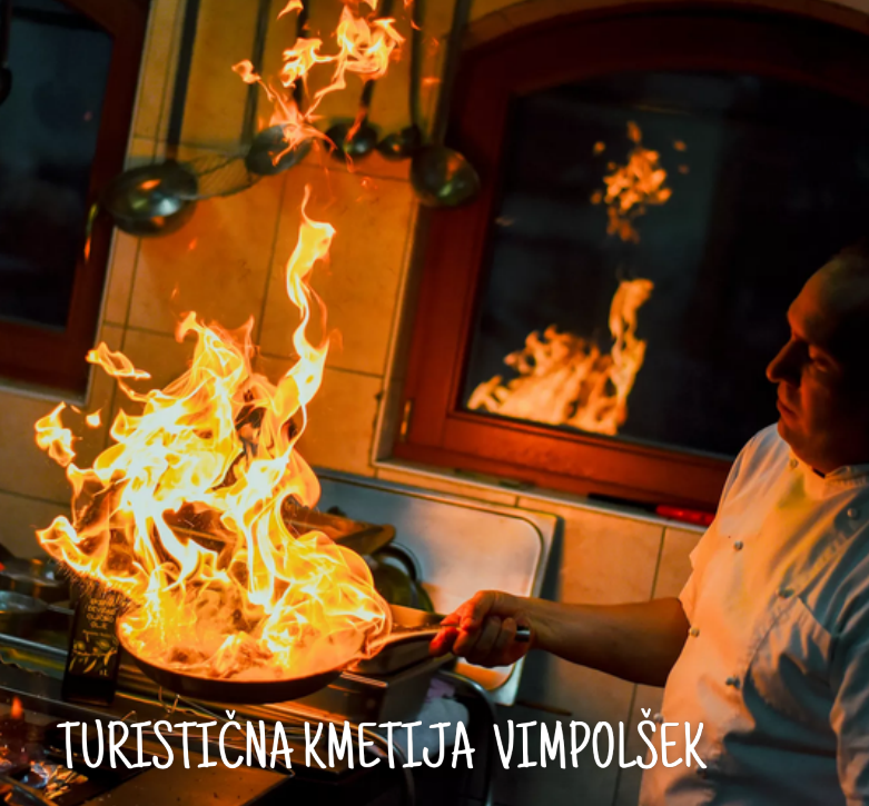
TURISTIČNA KMETIJA VIMPOLŠEK