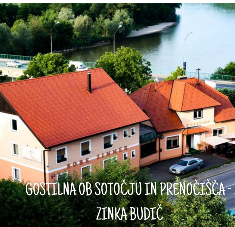
GOSTILNA OB SOTOČJU IN PRENOČIŠČA - ZINKA BUDIČ