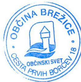
Župan Občine Brežice Ivan Molan

Številka: 410-20/2017 Brežice, dne 12.5.2017