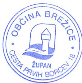
Ivan Molan, župan občine Brežice

Za spremljanje izvajanja letnega programa je pristojen imenovani strokovni svet za področje kulture Občine Brežice.