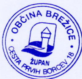
Ivan Molan Župan občine Brežice

Za spremljanje izvajanja letnega programa je pristojen imenovani strokovni svet za področje mladine Občine Brežice.