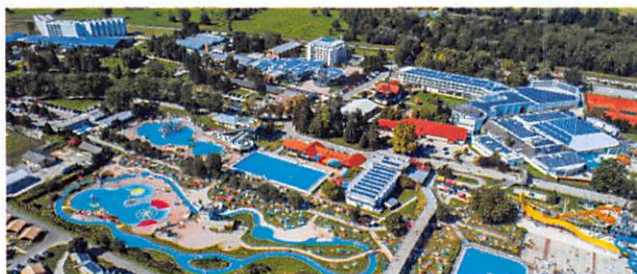
Slika: Terme Čatež - največje slovensko naravno zdravilišče in ena izmed najprivlačnejših turističnih destinacij v Sloveniji