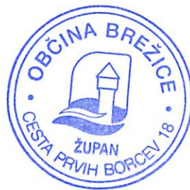
Ivan Molan Župan občine Brežice

Za spremljanje izvajanja letnega programa je pristojen imenovani strokovni svet za področje mladine Občine Brežice.